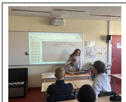
Création du musée