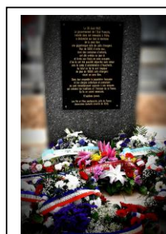
Stèle pour ne pas oublier à Vichy